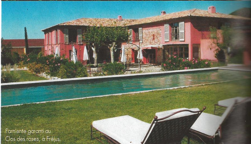
Farniente garanti au Clos des roses, à Fréjus.